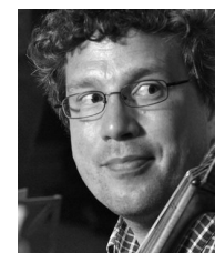
Violoncelle et direction artistique du Concert Lorrain